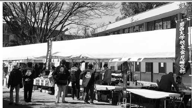
多くの校友で賑わう、各支部のテント村